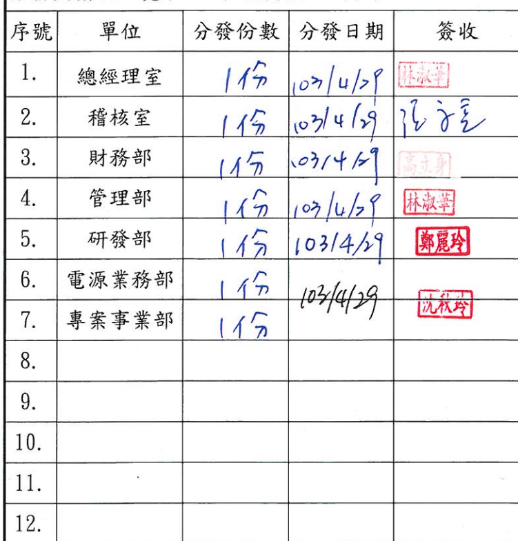
分發與簽收一覽表 (總頁數 6 頁)